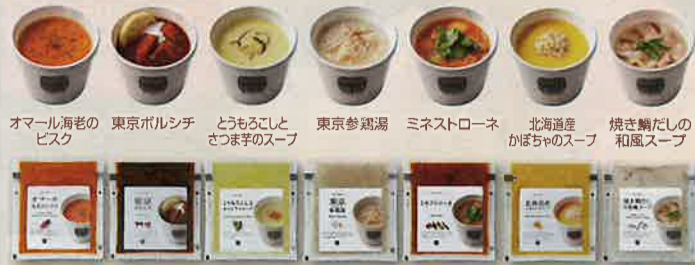
オマール海老のビスク 東京ボルシチ さつま芋のスープ とうもろこしとさつま芋のスープ 東京参鶏湯 ミネストローネ 北海道産かぼちゃのスープ 焼き鯖だしの和風スープ

Soup Stock Tokyoは、「食べるスープの専門店」です。時間をかけて丁寧に引き出されたスープストック(だし)は、食材のおいしさを味わっていただくため、余計なものを使用せず、素材が持つ自然な味と風味を大切にしながら、一つ一つ作りあげています。