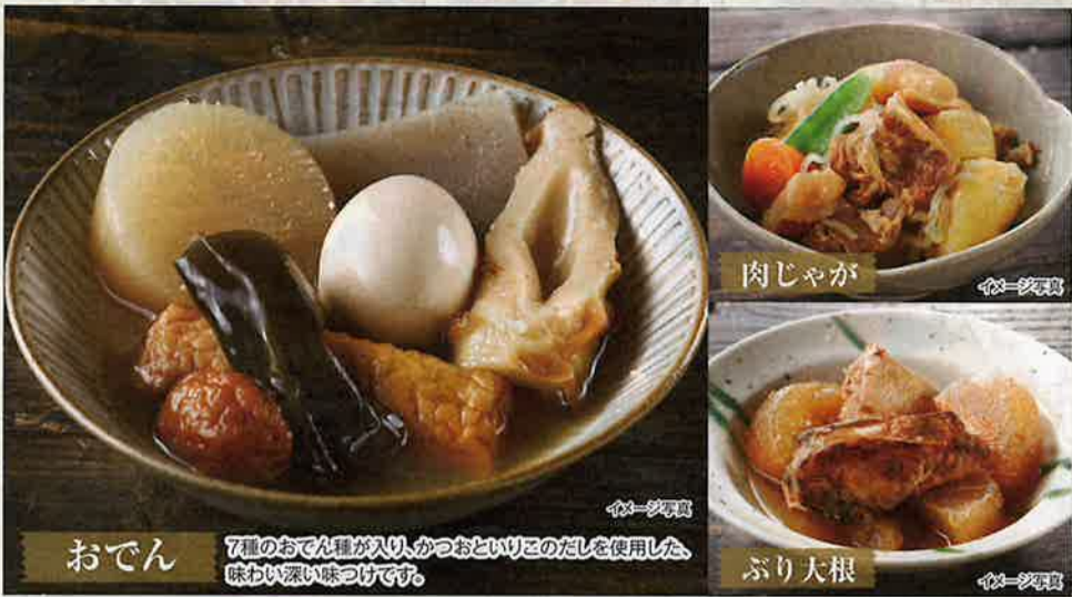
おでん 7種のおでん種が入りかつおといりこのだしを使用した、味わい深い味つけです。 肉じゃが ぶり大根

ロングライフ 賞味期間 3年 災害時に おつまみに キャンプに 3種×各2袋 (計6袋) 温めなくてもそのまま食べられます。