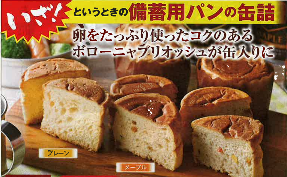
というときの 備蓄用パン の缶詰 卵をたっぷり使ったコクのある ボローニャブリオッシュが缶入りに

長期保存おふくろの味 惣菜セット 940 本体価格 3,700円 (税込3,996円) おふくろの味のお惣菜3種を詰め合わせました。急な時の一品やいざという時の災害時でもOK。温めなくてもそのまま食べられるので非常時でも活躍します。